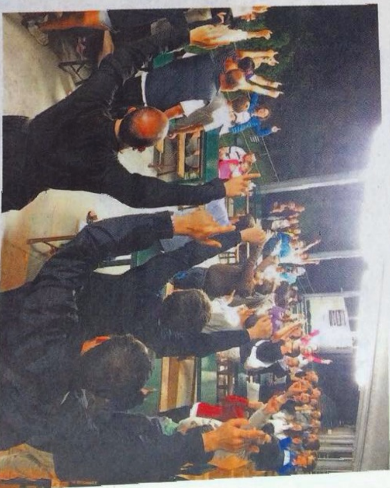
Un'immagine di festa alla Tendopoli

presso l'Istituto Teologico di Ancona. In serata tend fest con Dj Maick. Domani alle ore 9.30 apriranno la mattinata di rifles-